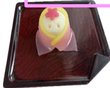
ひな人形練り切り(2日)